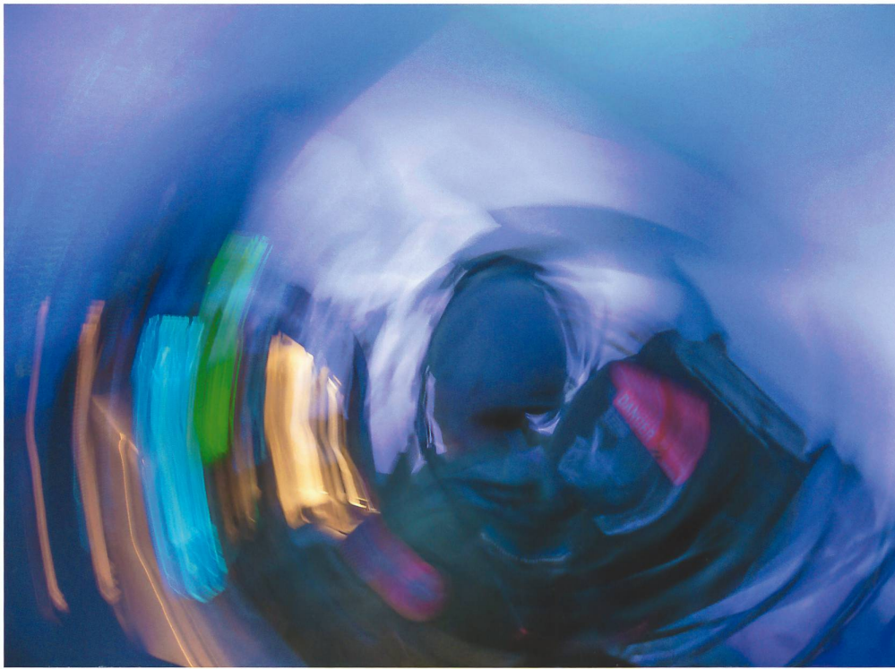
Mit «Röhrenblick»: Im Simulator werden Jetpiloten an ihre Grenzen geführt.

Urs Kühne, Instruktor und Berufsmilitärpilot, eingeteilt im Luftwaffenstab A3/5. Sie beide werden den Piloten nun in die Hypoxie führen. Fluginstruktor Kühne übernimmt die Rolle des Tactical Fighter Controllers , welcher die eigentliche Mission steuert. Er simuliert die Wetterkonditionen und überprüft sämtliche Abläufe im Cockpit über einen der vielen Bildschirme vor ihm. Kunz kümmert sich um den Sauer- und Stickstoff und behält den Piloten ebenfalls ständig im Auge.