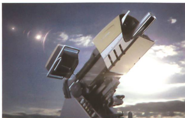
RUAG COBRA Mörsersystem

Das RUAG COBRA 120 mm Mörsersystem ist ein Hightech-Produkt, das neue Massstäbe für indirekte Feuersysteme setzt. Ein elektrischer Antrieb und eine halbautomatische Ladevorrichtung sorgen für entscheidende Präzision und Schnelligkeit. RUAG COBRA kann einfach auf jedem Rad- oder Kettenfahrzeug montiert werden und ist so ausgelegt, dass die Nutzer das System schon nach kurzer Schulungsdauer versiert einsetzen können.