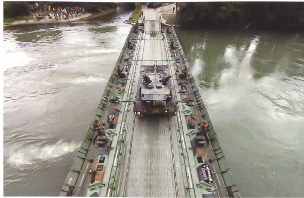
Die Führungsreglemente der Armee schlagen die Brücke zwischen den Doktrinvorgaben der Armee und dem Einsatz.

setzung geht nie ohne Führung. Kader müssen diese zuerst und immer beherrschen, sonst bleibt kein Platz mehr für die kreative inhaltliche Problemlösung. Führung ist Mittel zum Zweck, aber gute Führung reicht weiter: Sie gibt Halt für alle möglichen – auch inhaltlichen – Fiktionen, die mit Sicherheit eintreffen. Die-