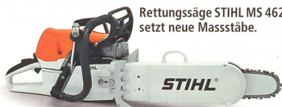
Rettungssäge STIHL MS 462 C-M R setzt neue Massstäbe.

Ihr beispielhaft niedriges Gewicht, der einfache Startvorgang und die hochwertige Spezialausstattung machen die Rettungssäge STIHL MS 462 C-M R zum optimalen Gerät, wenn es um effizientes Arbeiten im Rahmen von Rettungseinsätzen bei der Feuerwehr oder im Katastrophenschutz