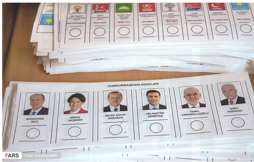
Wahlzettel für die Präsidentschaftswahlen vom 24. Juni 2018.

Unterstützung des von der Hamas gegen den Staat Israel geführten asymmetrischen Krieges. Die Türkei gewährt vielmehr auch konkrete operative Hilfe und erlaubt der Hamas-Führung, ihre Terroraktionen von einem Hauptquartier auf türkischem Boden aus vorzubereiten und zu steuern. Selbst für den Transport von Waffen an die islamistische Terrorgruppe Hamas im Gaza stellt die Türkei seit Anfang 2011 ihre Häfen zur Verfügung. Die sorgfältige Untersuchung einiger von der israelischen Marine im Mittelmeer aufgebrachter Frachter, die moderne Waffen aus dem