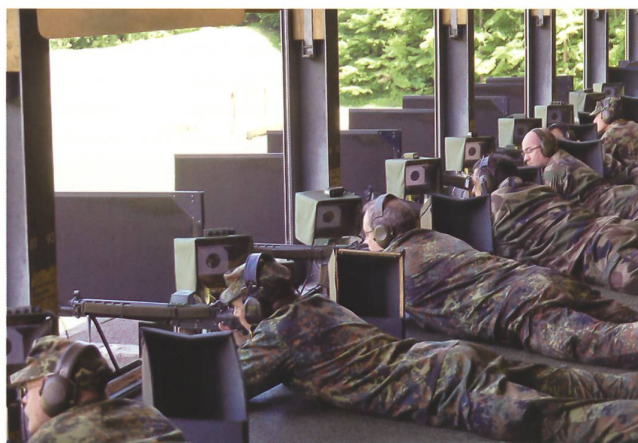
Wettkampf 300 m.