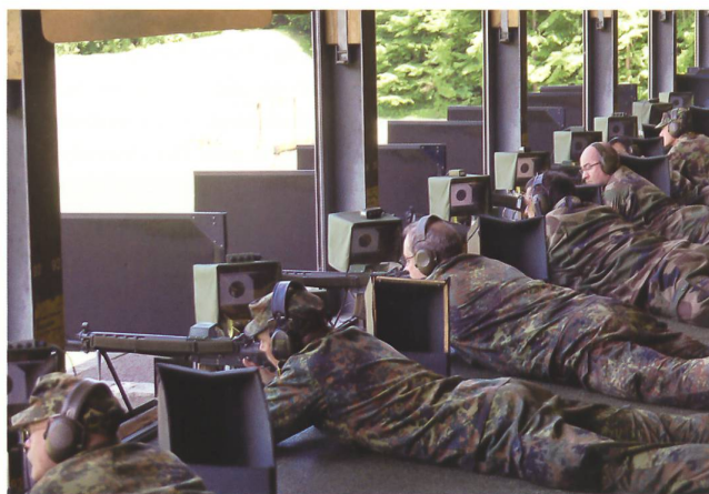
Wettkampf 300 m.