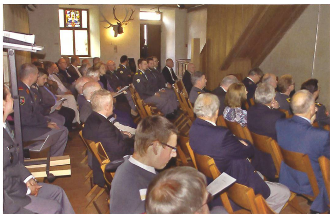
Gut besuchte Generalversammlung auf der Kyburg.