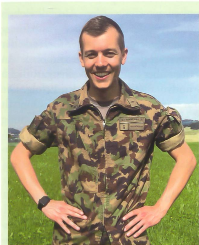
Ein erleichtertes Kadi nach dem erfolgreichen Abverdienen.

der ODA festgelegten «Jokertage» dar. Jeder Rekrut und Kader darf während der Dauer der Rekrutenschule an zwei frei wählbaren Tagen, sofern es der Dienstbetrieb zulässt, unbegründet Urlaub beziehen. Der administrative Aufwand, diese konsequent und fair zu verwalten, war immens. Zu Spitzenzeiten waren 25% meiner Kompanie im Urlaub und gesamthaft musste ich ca. 200 Gesuche bearbeiten, welche im Anschluss vom Feldweibel weiterverarbeitet wurden. Ich stelle mir hierbei die Frage: Woher ziehe ich die Berechtigung, wenn an einem Tag 25% der Kompanie im Urlaub sind, die restlichen 75% im Dienst zu halten? Es wäre mei-