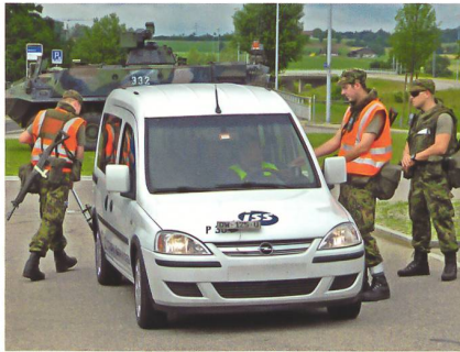
Hinter dem gerade kontrollierten Personenvan steht ein Spz «Piranha» zum Verhindern von Durchbrüchen.