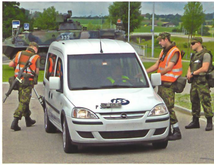
Hinter dem gerade kontrollierten Personenwagen steht ein Spz «Piranha» zum Verhindern von Durchbrüchen.