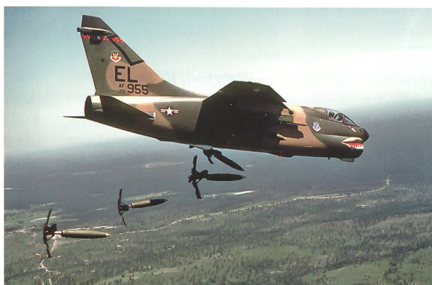
Die A-7 Corsair II war berühmt für ihre Treffsicherheit und Überlebensfähigkeit.

alternative wäre ein definitiver politischer Verzicht auf die Erdkampffähigkeit. Dann könnten Konzeption, Doktrin, Bestände und Bewaffnung des «Gesamtsystems Armee» langfristig darauf ausgerichtet werden, diese Fähigkeitslücke wenigstens im Rahmen des Möglichen zu kompensieren. ■