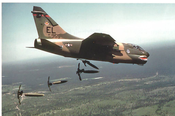
Die A-7 Corsair II war berühmt für ihre Treffsicherheit und Überlebensfähigkeit.

alternative wäre ein definitiver politischer Verzicht auf die Erdkampffähigkeit. Dann könnten Konzeption, Doktrin, Bestände und Bewaffnung des «Gesamtsystems Armee» langfristig darauf ausgerichtet werden, diese Fähigkeitslücke wenigstens im Rahmen des Möglichen zu kompensieren. ■