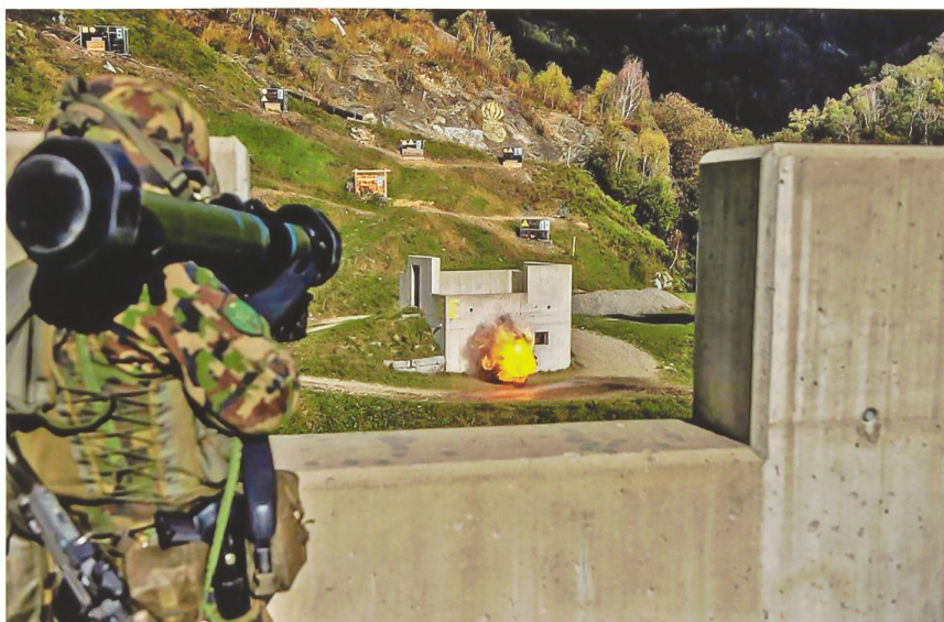
Abb. 1: Die Recoilless Grenade Weapon, HEAT & HESH (RGW 90 HH) verfügt im Vergleich zur Panzerfaust nicht nur über eine erhöhte Reichweite, sondern bietet auch zusätzliche Wirkungsmöglichkeiten beim Kampf im überbauten Gelände.

Diese Zweckbestimmung der Infanterie findet in der Taktischen Führung 17 (TF 17) ihren Niederschlag. Unter den Verteidigungsaufgaben wird sowohl bei der Bekämpfung bewaffneter Gruppen (Ziff 7094) als auch bei Angriffen im überbauten Gelände (Ziff 7190) an erster Stelle