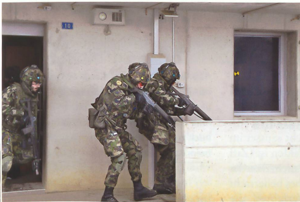
Die «Scorpions» mussten in Nalé rund 30 Häuser säubern.

vor allem zu Beginn der Trainingseinheit aus. Im Unterschied zu ersteren, die in jedem WK Zeit fänden, ihre Kernaufgaben zu trainieren, sei es bei den Infanteristen anfangs erkennbar gewesen, dass sie schon länger nicht mehr auf dieser hohen Eskalationsstufe geübt hätten. Ein Unterstützungs-WK wie jener 2017 für die Ski-WM in St. Moritz sei zwar eine gute Führungsübung für die Kader, gefechtstechnisch gehe aber einiges verloren. Dies müsse zuerst wieder aufgearbeitet werden. Auffallend für ihn war aber, dass das Bataillon auf allen Stufen ausgezeichnet auf FANTASSIN 18 vorbereitet war und daher rasch in der Lage