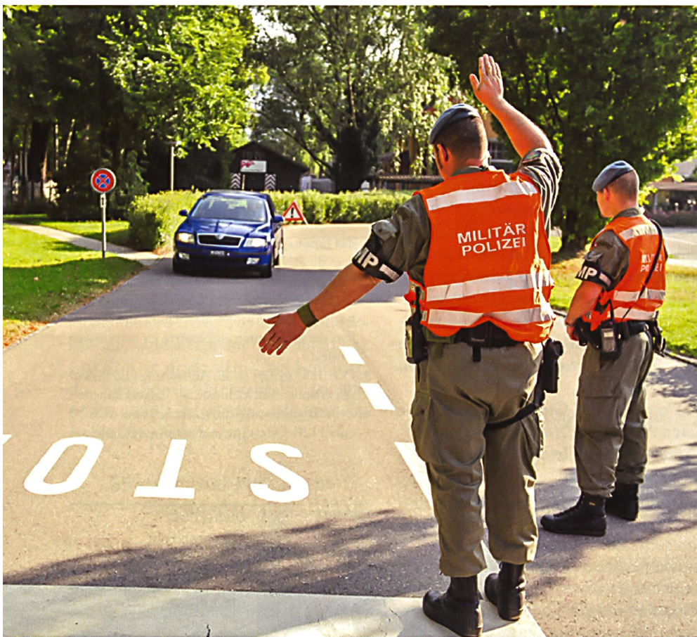
AdMP bei einer Zufahrtskontrolle.

Die für die vier MP Bataillone vorgesehenen AdA und die meisten angehenden Berufsleute des Einsatzkommandos MP Sicherheitsdienst (Ei Kdo MP Sich D) absolvieren die MP Rekrutenschule 19. Damit das Ei Kdo MP Sich D den vorgesehenen Bestand erreicht, sollen zudem Durchdiener der MP Bereitschaftskompanie (MP Ber Kp) und Interessenten aus anderen Truppengattungen dazu stossen. Unter der Leitung des Kompetenzzentrums MP wird ein interner Grundkurs (GK MP Sich D) für MP Sicherheitsunteroffiziere (MP Sich Uof) durchgeführt. Diese Grundausbildung dauert sechs Monate. Die Angehörigen des Ei Kdo MP