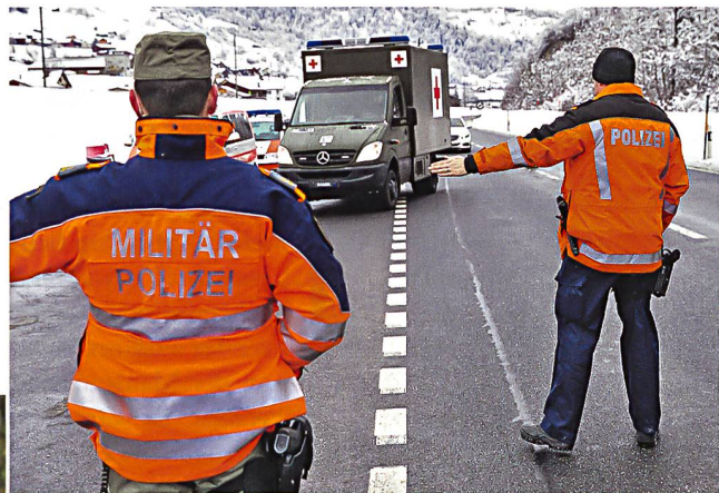
Fahrzeugkontrolle durch Polizei und Militärpolizei.

ximal drei Wochen anordnen, darüber hinaus ist die Zustimmung der Bundesversammlung notwendig. Die möglichen Beiträge der Armee sind dabei vielfältig. Das Militär kann den Polizeikräften gepanzerte Einsatzfahrzeuge zur Verfügung stellen, mit Luftaufklärung die Täterfahndung unterstützen oder Bombenentschärfungen vornehmen. Die militärische Leistungserbringung konzentriert sich in erster Linie auf Unikat- oder Nischenfähigkeiten, welche viele Polizeikörpers in diesem Umfang nicht besitzen. Armeeeinsätze im Inland sind daher vorwiegend komplementär zu den Polizeiaufgaben. Darüber hinaus kann die Armee im Rahmen einer Terrorlage auch grossräumige Sicherungs- und Objektschutzaufgaben wahrnehmen, welche die laufenden Polizeieinsätze stellenweise substituieren. Bei dieser Art von Einsätzen übernehmen die Soldaten hoheitliche Aufgaben, das heisst sie verfügen über die notwendigen Polizeibefugnisse zur Auftragsbefüllung.