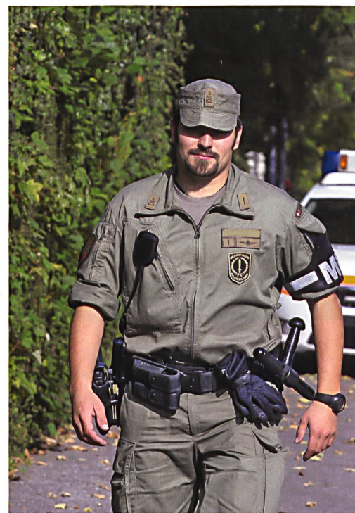
Polizistin und Militärpolizist auf Patrouille.

Auch in der Schweiz ist bei solchen Fällen ein Armeeeinsatz im Inland rechtlich möglich. Der Bundesrat kann einen subsidiären Einsatz von bis zu 2000 Soldaten und einer Dauer von ma-