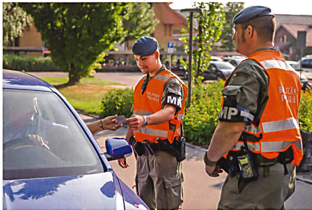
Grundversorgung – Patrouille der MP bei der Personenkontrolle.

Neben den zu erfüllenden militärpolizeilichen Grundleistungen und gegebenenfalls der Sicherstellung des Militärstrafgefangenenwesens innerhalb der Armee kann das Kommando Militärpolizei im Rahmen der Verteidigung auch Leistungen zur Unterstützung anderer Formationen der Armee oder ziviler Behörden erbringen. Dabei können vornehmlich die Milizformationen des Kommandos Militärpolizei in den Bereichen Schutz von