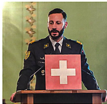
Der neue Präsident, Oberstlt i Gst Pierre Olivier Moreau.

Im Zentrum stand die Frage, ob wir uns am Vorabend einer Technologiezäsur befinden, gepaart mit einer deutlich verschlechterten allgemeinen Lage.