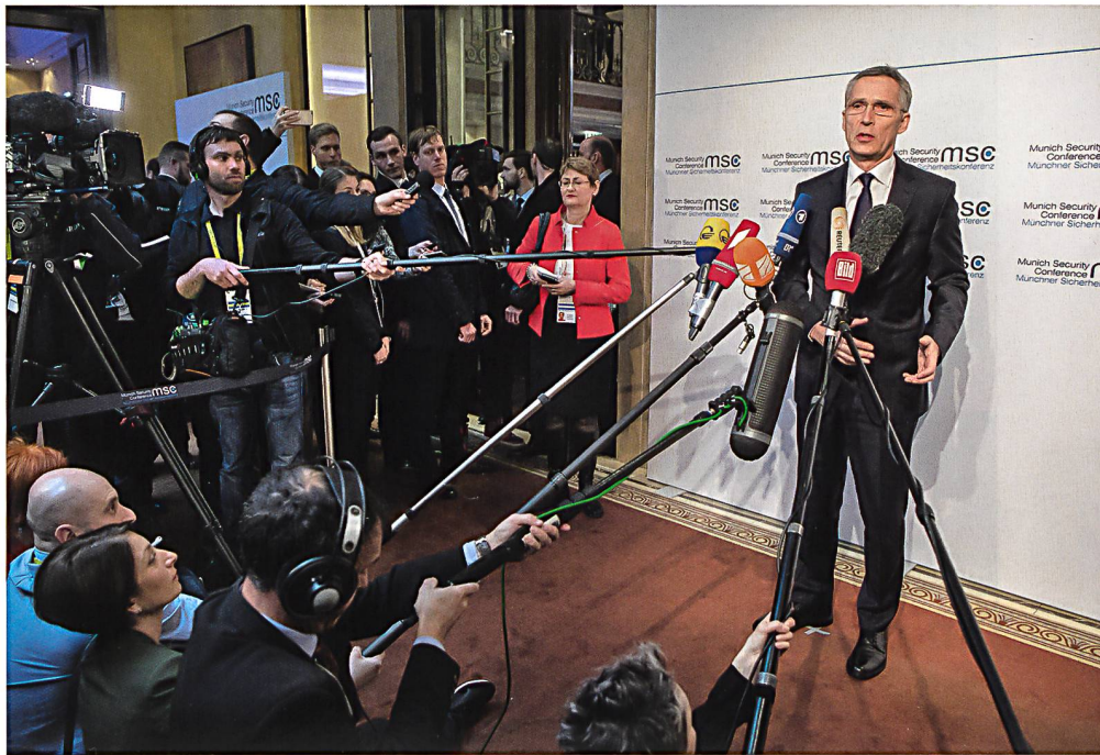
NATO-Generalsekretär Jens Stoltenberg.

Der Sicherheitsberater Präsident Donald Trumps, Generalleutnant Herbert R. McMaster, geisselte Nordkorea und andere «Schurkenregimes» wie Iran mit harten Worten. Es gelte Kim Jong Un unter steigenden Druck zu setzen. Nordkorea dürfe sich nie und nimmer als Atommacht etablieren. McMaster widersprach Auffassungen, wonach die neue amerikanische Nuklearstrategie und insbesondere die Entwicklung von Atomwaffen kleinerer Kaliber die Kriegsschwelle senkten, was anwesende amerikanische Politiker bekräftigten. Auch eine «Strategie der blutigen Nase» gegenüber Nordkorea, wie dies in Zeitungsartikeln gelegentlich erwähnt