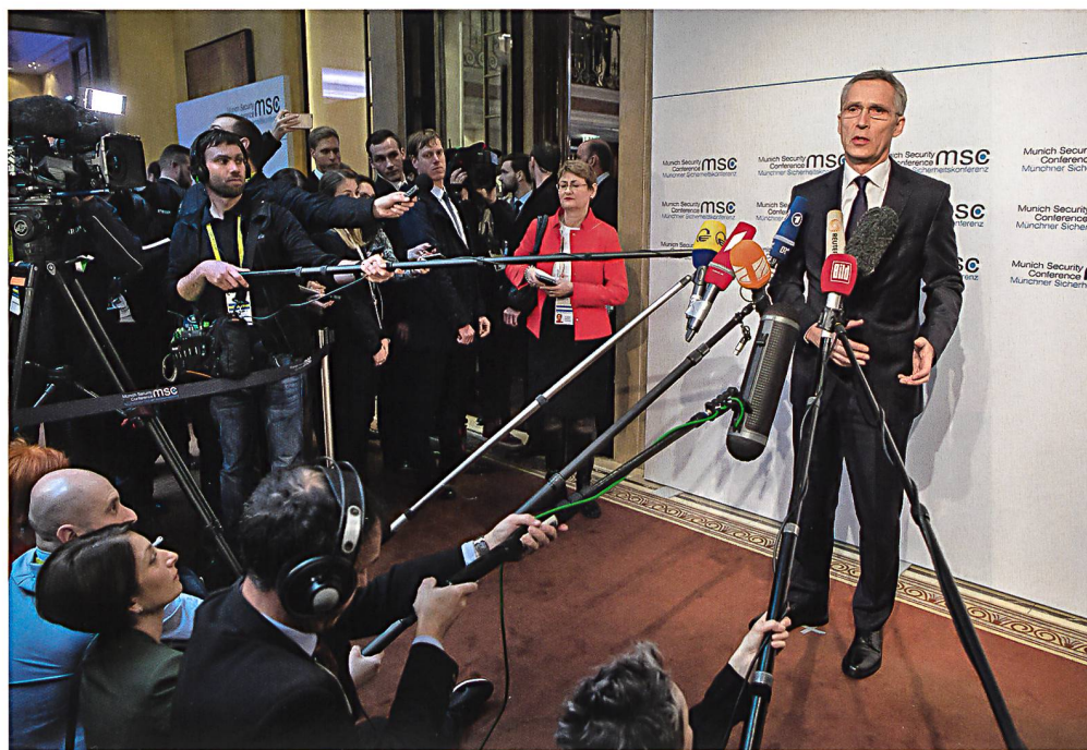
NATO-Generalsekretär Jens Stoltenberg.

Der Sicherheitsberater Präsident Donald Trumps, Generalleutnant Herbert R. McMaster, geisselte Nordkorea und andere «Schurkenregimes» wie Iran mit harten Worten. Es gelte Kim Jong Un unter steigenden Druck zu setzen. Nordkorea dürfe sich nie und nimmer als Atommacht etablieren. McMaster widersprach Auffassungen, wonach die neue amerikanische Nuklearstrategie und insbesondere die Entwicklung von Atomwaffen kleinerer Kaliber die Kriegsschwelle senkten, was anwesende amerikanische Politiker bekräftigten. Auch eine «Strategie der blutigen Nase» gegenüber Nordkorea, wie dies in Zeitungsartikeln gelegentlich erwähnt