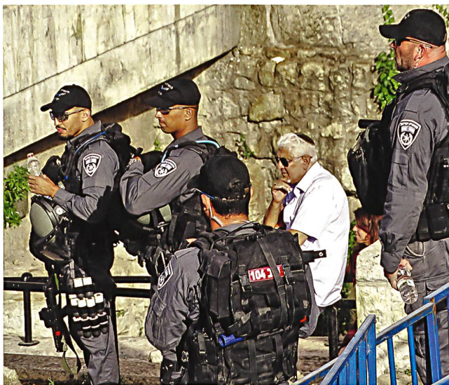
Israelische Polizisten vor dem Damaskus-Tor zur Jerusalemer Altstadt – einem besonders gefährdeten Ort für palästinensische Anschläge.

Die Motive von Attentätern sind breit gestreut und reichen von klassischem Na-