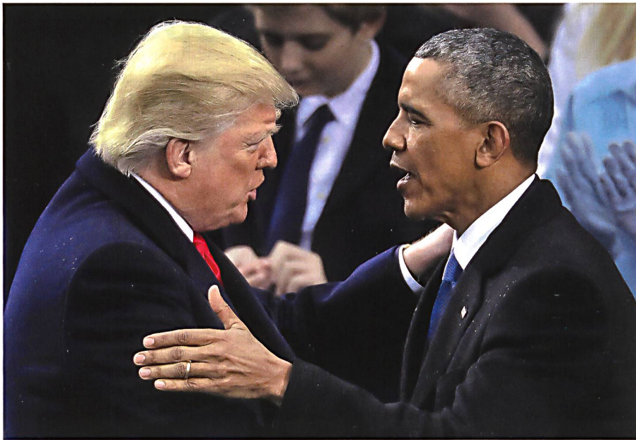
Präsident Obama gratuliert Präsident Trump nach der Vereidigung (Januar 2017).