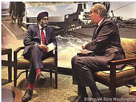
Bilaterales Treffen zwischen Bundesrat Parmelin und Verteidigungsminister Sajjan in Kanada anlässlich des Halifax International Security Forum 2017.

Anlässlich des Todes von vier Angehörigen der US-Spezialkräfte in Niger im Oktober 2017 wurde wieder öffentlich über den Einsatz der USA auf dem afrikanischen Kontinent gesprochen. In der Sahel-Zone unterhalten die US-Streitkräfte einen Drohnenstützpunkt und unterstützen die nigrischen Sicherheitskräfte im Kampf gegen gewalttätigen Extremismus in der Region.