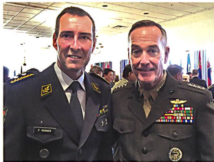
Begegnung mit dem Chairman of the Joint Chiefs of Staff, General Joseph F. Dunford Jr.

Gegenüber der Institution des amerikanischen Präsidenten ist man loyal eingestellt.