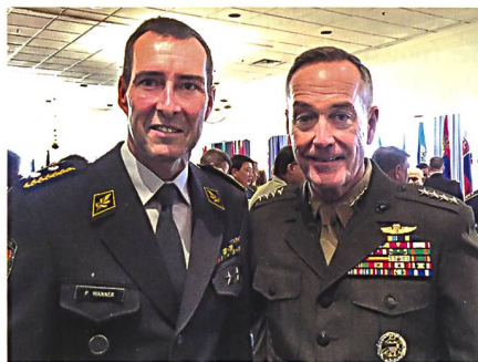
Begegnung mit dem Chairman of the Joint Chiefs of Staff, General Joseph F. Dunford Jr.

Evening Parade des United States Marines Corps: der VA Washington an diesem Anlass in der Rolle des Doyen.