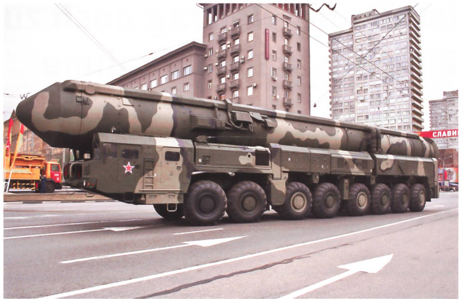
Topol-M, eine ballistische Interkontinentalrakete bei der Vorbereitung zur Siegesparade in Moskau.

Auf dem Tisch beider Häuser des US-Kongresses liegt derzeit der sogenannte «INF Preservation Act». Im Grunde will er der Gegenseite die «Instrumente» aufzeigen. Moskau soll bewogen werden, zur INF-Vertragstreue zurückzukehren. Der klare materielle Bruch des INF-Vertrages gäbe den USA das Recht, die Anwendung des INF-Vertragsregimes zu suspendieren. Solange sich Russland weiter non-compliant verhalte, seien eine Reihe von offensiven und defensiven Massnahmen vorzusehen. Für die Entwicklung eines strassen-