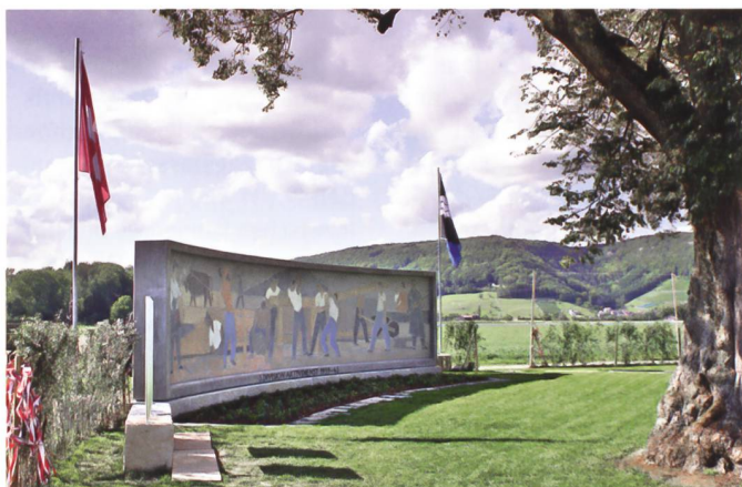
Das restaurierte Denkmal der 5. Division zum Aktivdienst 1939–1945 auf dem Villigerfeld.

Exakt 77 Jahre nach der ersten Einweihung wurde das sorgfältig restaurierte Denkmal den vier Anstössergemeinden Rüfenach, Brugg, Remigen und Villigen zurückgegeben. An der Feier nahmen auch hohe zivile und militärische Gäste teil. So waren