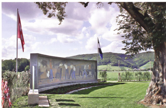
Das restaurierte Denkmal der 5. Division zum Aktivdienst 1939–1945 auf dem Villigerfeld.

Exakt 77 Jahre nach der ersten Einweihung wurde das sorgfältig restaurierte Denkmal den vier Anstössergemeinden Rüfenach, Brugg, Remigen und Villigen zurückgegeben. An der Feier nahmen auch hohe zivile und militärische Gäste teil. So waren