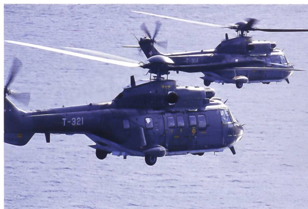
Super Pumas in Portugal: 630 Tonnen Wasser und 328 Rotationen wurden im Einsatz geflogen.

Am Samstagmittag, 19. August hoben die Super Pumas vom Militärflugplatz