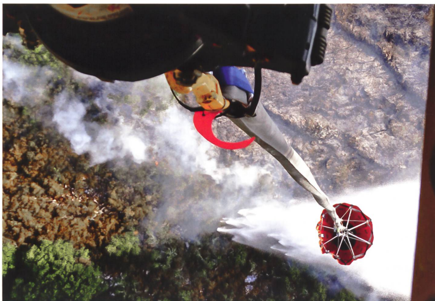
Blick aus dem Super Puma: Wasser für den Flankenschutz.

Keiner wusste so genau, was ihn erwarten würde. Operiert wurde ab der grössten portugiesischen F-16 NATO-Militärbasis in Monte Real, rund 120 Kilometer nördlich von Lissabon. Kurzerhand wurden für die Einstellung der Super Pumas portugiesische Kampfjets aus den Hangars geschoben und Platz für die gesamte Logistik der Schweizer Soforthelfer geschaffen.