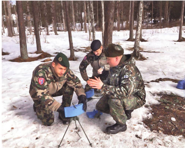
Ausbildung an Minen.

Seit dem Frühjahr 2014 haben Marine- und Luftwaffenaktivitäten der RUS in der Ostsee und dem finnischen Meerbusen zugenommen. Vor allem die RUS Anti Access