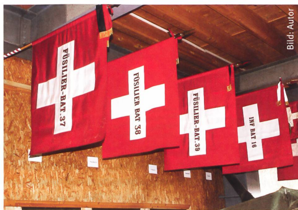
Die vier Bataillionsfahnen des ehemaligen Inf Rgt 21 vervollständigen die Fahnengalerie der Gz Br 5 im Militärmuseum Full.

schen zur beweglicheren Abwehr übergegangen war. Das hiess, dass sie nicht mehr in den Stellungen auf den Feind «warten», sondern ihn aus den Stützpunkten heraus mit Gegenstössen bekämpfen sollte.