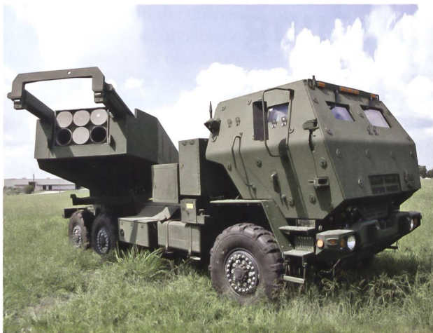
Einzelgeschütz als Ziel für Konterfeuer (HIMARS, Lockheed Martin)