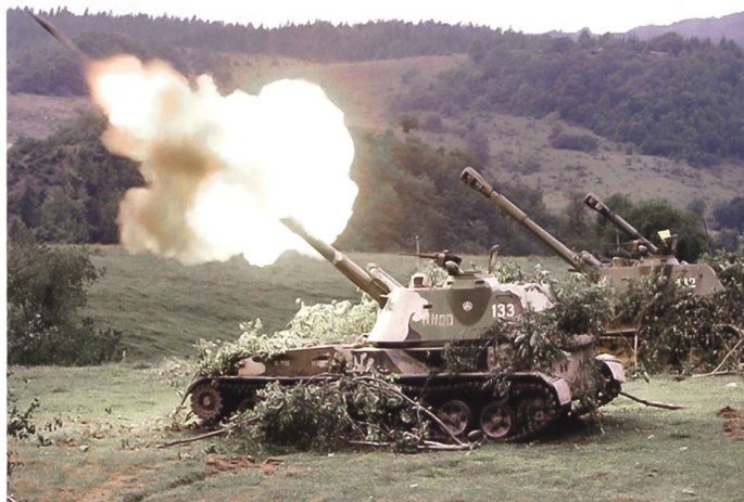
Lineare Feuerstellung als Ziel für Konterbatteriefeuer.

scheidend, weil die Artillerie des Gegners nicht mehr aus kompakten Stellungen feuert oder ihre Batterien linear aufgestellt werden. Das ist nur der Fall, wenn die Konterfeuerfähigkeit der gegnerischen Artillerie nicht, die eigene Luftüberlegenheit hingegen sehr wohl vorhanden sind. Das Feuer eines einzelnen Geschützes, eines Mörsers oder eines Raketenwerfers ist die Regel. Diese Konterfeuerziele können nur mit präziser Munition bekämpft werden.