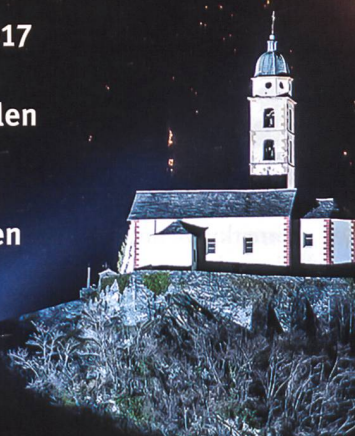
Waldbrand im Raum Mesocco.

Vom 27. Dezember 2016 bis am 12. Januar 2017 bekämpften täglich bis zu 100 Einsatzkräfte mit Unterstützung von militärischen und zivilen Löschhelikoptern die Waldbrände im Misox und im Calancatal (GR). Die Zusammenarbeit zwischen den betroffenen Gemeinden und den beteiligten Partnern Kantonspolizei, Feuerwehr, Forstdienst, Sanität, Zivilschutz und Schweizer Armee erfolgte kooperativ und war von gegenseitigem Vertrauen geprägt.