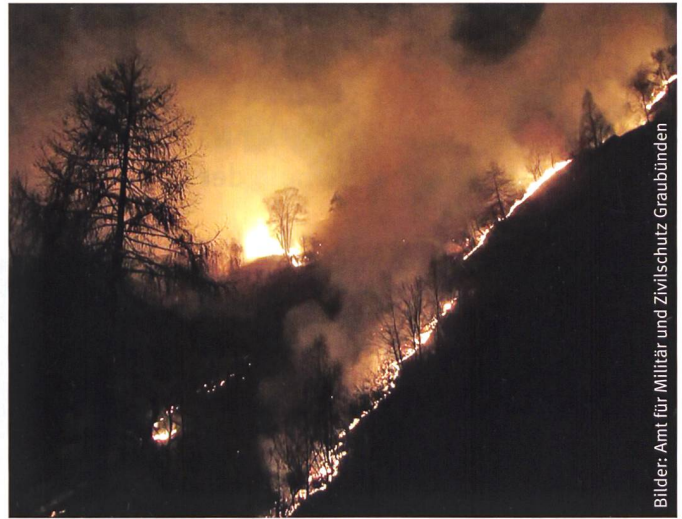
Waldbrand im Calancatal.