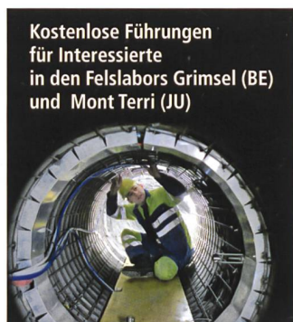
Kostenlose Führungen für Interessierte in den Felslabors Grimsel (BE) und Mont Terri (JU)

ten, forscht die Nagra zusammen mit anderen Nationen in zwei Felslabors in der Schweiz, welche von Gruppen jederzeit kostenlos besucht werden können.