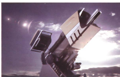
RUAG COBRA Mörsersystem

Das RUAG COBRA 120 mm Mörsersystem ist ein Hightech-Produkt, das neue Massstäbe für indirekte Feuersysteme setzt. Ein elektrischer Antrieb und eine halbautomatische Ladevorrichtung sorgen für entscheidende Präzision und Schelligkeit. RUAG COBRA kann einfach auf jedem Rad- oder Kettenfahrzeug montiert werden und ist so ausgelegt, dass die Nutzer das System schon nach kurzer Schulungsdauer versiert einsetzen können.