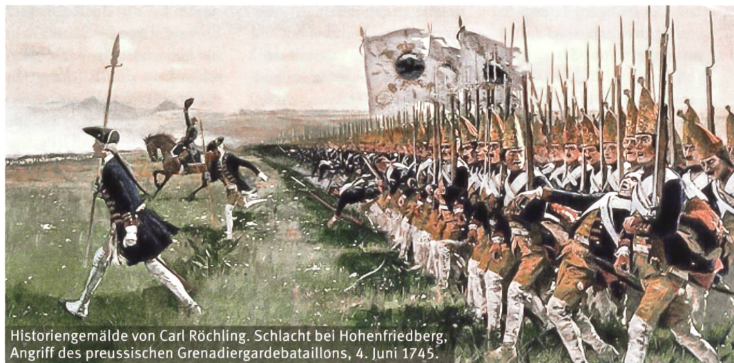
Historiengemälde von Carl Röchling. Schlacht bei Hohenfriedberg, Angriff des preussischen Grenadiergardebataillons, 4. Juni 1745.

Mit der Linertaktik verändert sich die europäische Kriegstechnik.