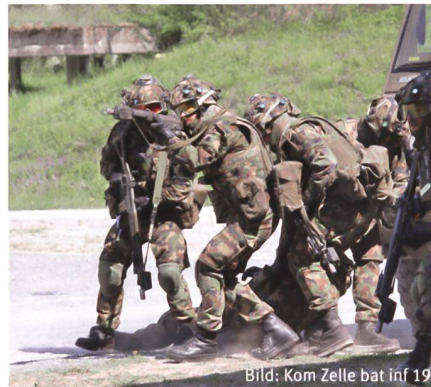
Bild: Kom Zelle bat inf 19 Bergung von Verwundeten in der Schlussübung des bat inf 19.

14 Jahre lang befand sich das Hauptquartier der Brigade in St. Maurice d'Agaune (VS). Der Wille war offensichtlich, den Kanton Wallis durch einen grossen Verband zu ehren. Vernachlässigt wird die Tradition, die diese Stadt mit der Armee verbindet: Mauritius ist – was oft vergessen wird – der Schutzpatron der Infanterie. Die Legende überliefert seinen Mut und die Treue zu seinen Überzeugungen, die er mit seiner Thebaischen Legion während seines Martyriums am Ende des dritten Jahrhunderts zeigte. Dieses besondere und säkulare Band, welches die Abtei und