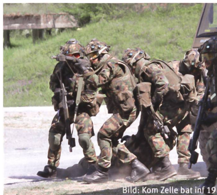
Bergung von Verwundeten in der Schlussübung des bat inf 19.

14 Jahre lang befand sich das Hauptquartier der Brigade in St. Maurice d'Agaune (VS). Der Wille war offensichtlich, den Kanton Wallis durch einen grossen Verband zu ehren. Vernachlässigt wird die Tradition, die diese Stadt mit der Armee verbindet: Mauritius ist – was oft vergessen wird – der Schutzpatron der Infanterie. Die Legende überliefert seinen Mut und die Treue zu seinen Überzeugungen, die er mit seiner Thebaischen Legion während seines Martyriums am Ende des dritten Jahrhunderts zeigte. Dieses besondere und säkulare Band, welches die Abtei und