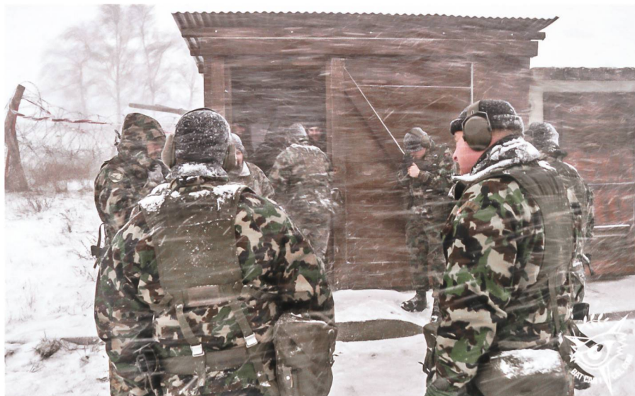
Militärischer Alltag: hart und erlebnisreich – aber eben nicht immer attraktiv.

Zwischen den beiden Übungen waren die Brigadverbände für die politischen Behörden im Einsatz: Das Infanterieba-