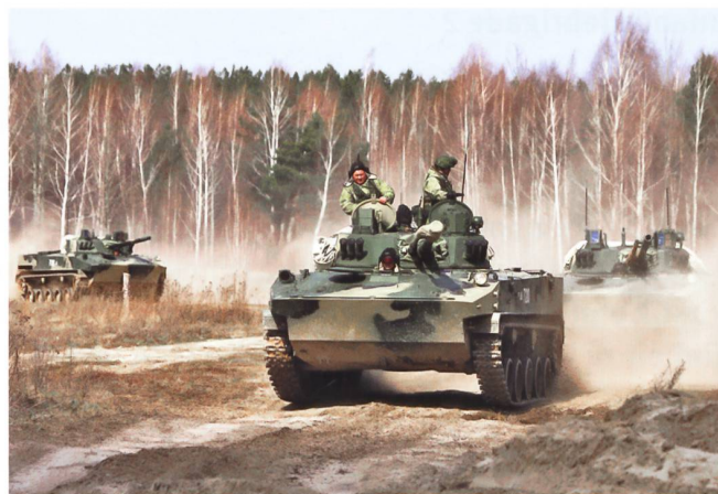
Neue Luftlandepanzer BMD-4M.