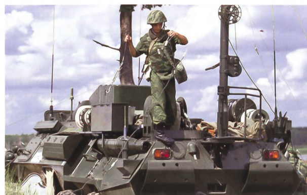
Mittel der EKF auf taktischer Stufe.

Aufsehen erregte bei westlichen Beobachtern die Beübung von Teilen der nuklearen Einsatzkräfte. So erfolgte am letzten Tag der Manöver der Abschuss einer bodengestützten ICBM vom Typ RS-24