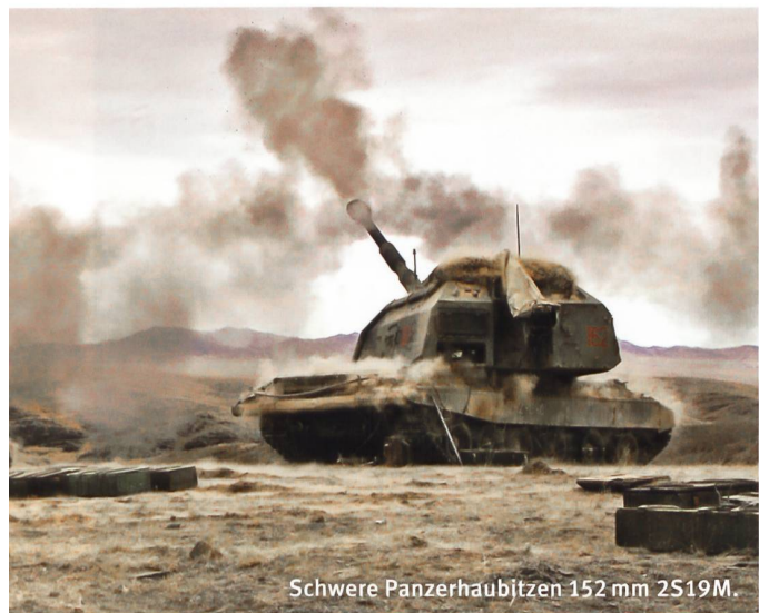
Schwere Panzerhaubitzen 152 mm 2S19M.

«Zapad 2017» war für Russlands Militärführung von besonderer Bedeutung. Mit dieser Übungsreihe sollten die umfassenden Veränderungen in diesem MB unter möglichst kriegsnahen Bedingungen ausgetestet werden. Dabei dürfte der verstärkte Einsatz von Mitteln der Elektronischen Kriegführung eine zentrale Rolle gespielt haben. Zudem sind vermutlich auch erste Erkenntnisse aus den beiden letzten Konflikten (Ukraine/Krim und Syrien) in diesen Manöverübungen berücksichtigt worden. ■