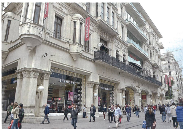
Demirören Shopping Mall Istanbul, Anschlag vom 16. März 2016.

Es begann mit einem Selbstmordattentäter, der sich am 8. Juli 2015 in Suruc, an der Grenze zu Syrien, in die Luft sprengte und mehr als 30 Menschen mit in den Tod riss. Die Hintergründe der Tat wurden nicht zweifelsfrei aufgeklärt.