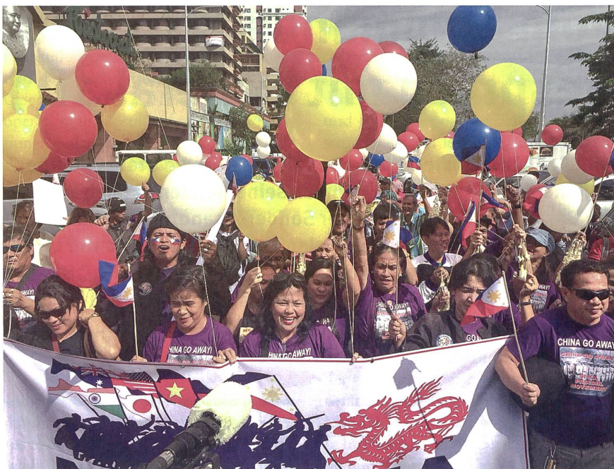
Manila am Tag der Publikation des Schiedsspruchs.

Die grosse Frage betrifft das Verhalten Vietnams. Bisher gab sich Hanoi bedeckt. Anders als die anderen Länder in der Seestreitigkeit setzt Vietnam auf die Internationalisierung des Konflikts. Bilaterale Lösungen werden als suboptimal eingestuft, da Hanoi befürchtet, China würde die anderen Staaten gegeneinander ausspielen. Es ist nicht ausgeschlossen, dass Vietnam den Schiedsspruch gezielt testen wird.