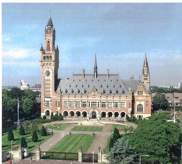
Sitz des Ständigen Schiedshofs in Den Haag.

Viel wichtiger noch: Manch grundlegende Frage wurde nicht gestellt – und nicht beantwortet. Zwar verneinte der Schiedshof die historischen Ansprüche Chinas – und indirekt der anderen Länder auch – und entzog damit der Neun-Striche-Linie ihre rechtliche Relevanz. Aber die Richter sagten nicht, die Linie an sich sei illegal. Ebenso beurteilten die Richter die Konformität der Landaufschüttungen. Sie stellten nur fest, diese begründen keine Hoheitsansprüche. Und überhaupt: Der Schiedshof erwägte lediglich im Rahmen des UN-Seerechtsübereinkommens.