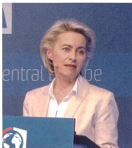
Eintrittsreferat der deutschen Verteidigungsministerin Ursula von der Leyen in Bratislava 2016.

Expertengespräch zum Thema «Die Zukunft der Geheimdienste in Deutschland». Wiederum waren Vertreter aus verschiedenen europäischen Ländern eingeladen, um ihre nationalen Lösungsansätze zu präsentieren, namentlich aus England, Frankreich und der Schweiz. Angesichts der Tatsache, dass in Deutschland, wo gegenwärtig an einem neuen «Gesetz zur Ausland-Fernmeldeaufklärung des Bundesnachrichtendienstes» und an einem «Gesetz zur weiteren Fortentwicklung der parlamentarischen Kontrolle» gearbeitet wird, ist kaum erstaunlich, dass das neue schweizerische Nachrichtendienst-Gesetz und die entsprechende Argumentation bei