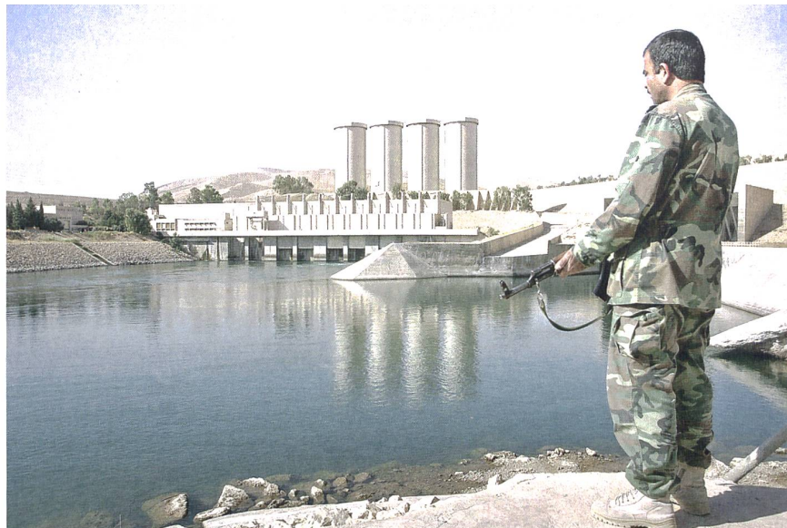
Der Staudamm im irakischen Mossul gilt als einer der am meisten gefährdeten der Welt. Wenn der Tigris im Frühjahr anschwillt, droht der Damm zu bersten.

schen Armee unterstützt, zurückeroberten. Kurdische Kämpfer bewachen derzeit den Staudamm. Damit kontrollieren sie auch die Stromversorgung sowie die Bewässerung in weiten Teilen des gesamten Iraks. So halten die Peschmerga, «die dem Tod ins Auge Sehenden», eine weitere Schlüsselposition auf dem Weg in eine vermeintliche Unabhängigkeit in ihrer Hand. Für die Kurden rückt möglicherweise ein Jahrhunderte alter Traum in greifbare Nähe. Als 1923 der Vertrag von Lausanne die Errungenschaften des Vertrages von Sèvres kurz nach dem Ersten Weltkrieg revidierte – darin war ein unabhängiges Kurdistan in Aussicht gestellt worden –, schienen die Hoffnungen der Kurden für lange Zeit begraben zu sein. Ein selbstständiger Staat für die fast 30 Millionen Menschen dieser westasiatischen Ethnie auf dem ehemaligen Gebiet des Osmanischen Reiches blieb für das folgende Jahrhundert eine Utopie. Doch der gemeinsame internationale Kampf gegen den Islamischen Staat im Irak aber auch in Syrien verlieh den Kurden Auftrieb. Unterstützt von den USA konnten die kurdischen «Volksverteidigungseinheiten» (YPG) im letzten Jahr dem IS neben der Grenzstadt