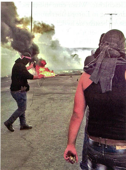
Strassenkämpfe zwischen Steine werfenden, arabischen Jugendlichen und der IDF sind zu einem alltäglichen Phänomen in Ost-Jerusalem und der West Bank geworden.

In 2015 verstärkten sich die Sicherheitsprobleme im Westjordanland und Jerusalem erheblich. Seit September kommt es beinahe täglich zu Attentaten mit Messern, Schusswaffen und Autos auf Israelis. Zwischen dem 13.09.2015 und 20.01.2016 wurden in 170 Terroranschlägen 29