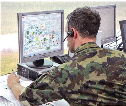
Stabsoffizier bei der Arbeit mit FIS HE.

Mit Umsetzung der Weiterentwicklung der Armee (WEA) ab 01.01.2018 geht es für die HKA nun darum, das FIS HE künftig in sämtlichen Milizlehrgängen einzusetzen. Dies stellt insbesondere für die ZS eine nicht zu unterschätzende Herausforderung dar. Folgend sollen der aktuelle Bearbeitungsstand des Ausbildungskonzeptes, spezifische Fragestellung und weitere Erkenntnisse, auch in Bezug auf die spätere Tätigkeit in den Einteilungsverbänden, aufgezeigt werden.