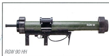
RGW 90 HH