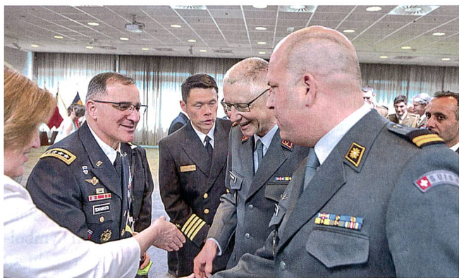
Oberst M. Widmer, Dept Mil Rep und Oberstlt i Gst N. Büchi, PNMR überbringen dem neuen Oberbefehlshaber der NATO und der US-Truppen in Europa, General C. Scaparrotti, SACEUR die besten Wünsche anlässlich des Change of Command.

Die PfP ist für die Schweizer Sicherheitspolitik eine 20-jährige Erfolgsgeschichte. Dank einer massgeschneiderten Beteiligung konnte sich die Schweiz in ihrem Interesse gezielt in die internationale diplomatische und militärische Friedensförderung einbringen. Damit die Präsenz der Schweizer Interessen auch in Zukunft der internationalen Sicherheitspolitik erhalten bleibt, muss sie sich mit flexiblen Lösungsansätzen und angepassten Konzepten den veränderten Gegebenheiten stellen. ■