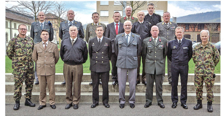
Besucher-Delegation von Military Representatives am Advanced Leadership Kurs für Unteroffiziere in Kiens.

Fahnenmeer vor dem NATO-HQ in Brüssel.