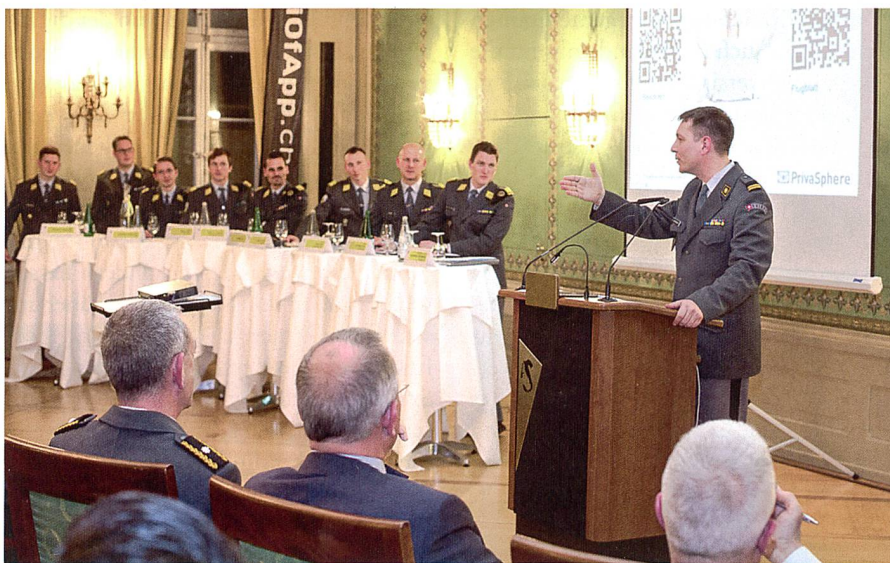
Der initiativ Vorstand der OG Panzer mit seinem Präsidenten.