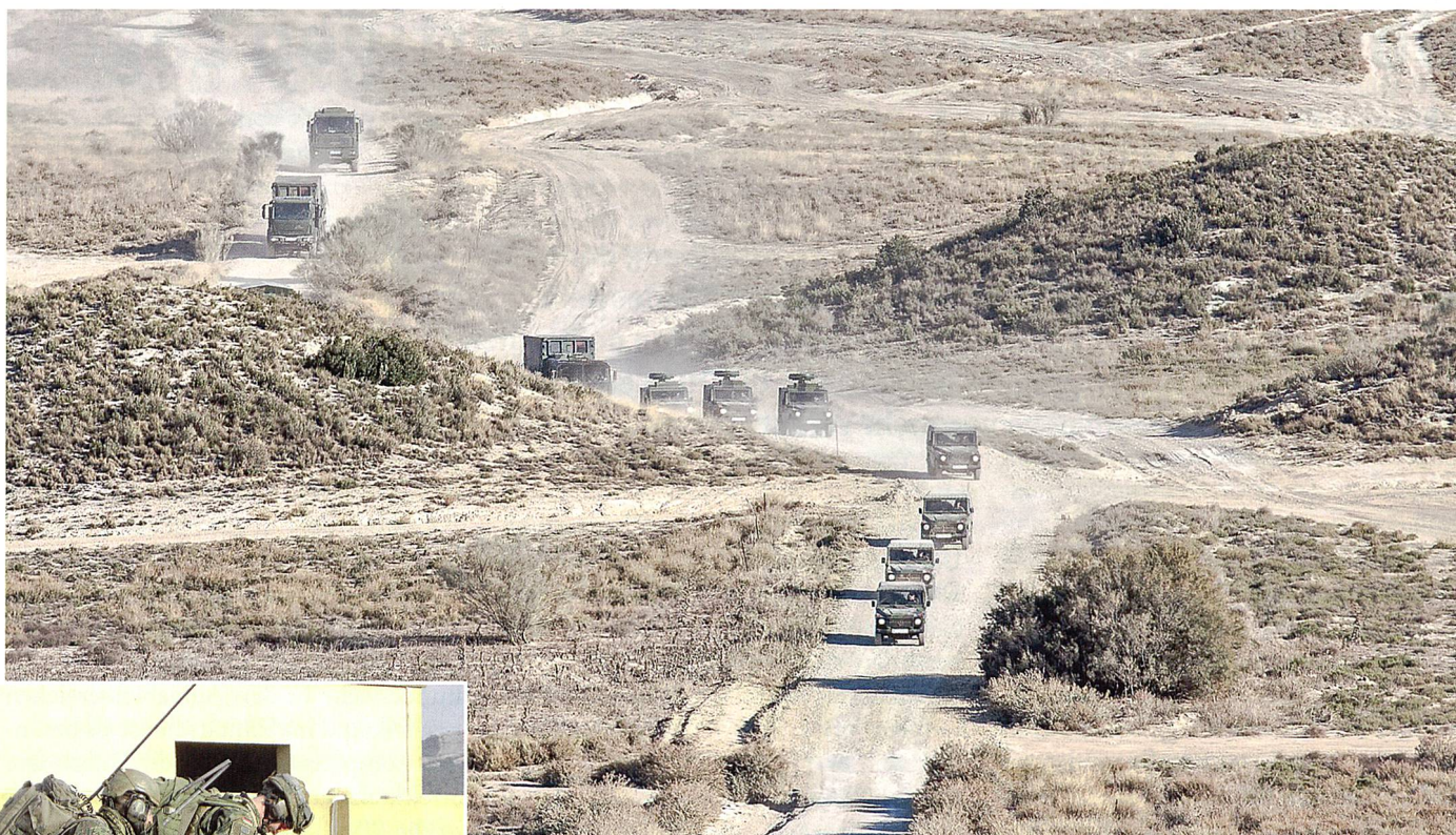
Fahrzeugkolonne auf dem Weg zum Camp Nord.