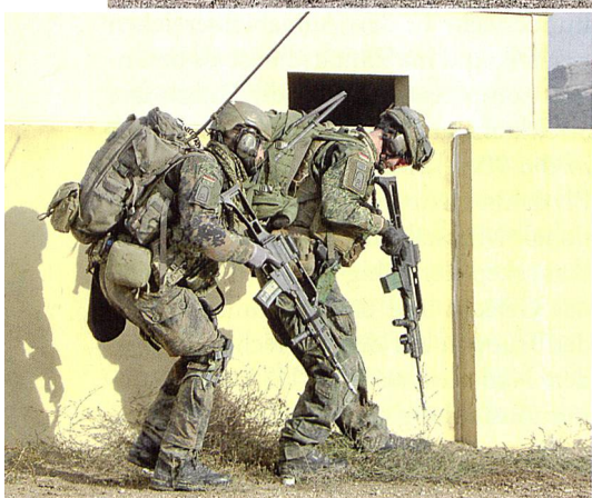
Soldaten des Gebirgsjägerbataillons 233 beim Häuserkampf.

mit der Reduzierung von kampfscheidenden Grossgeräts um rund ein Drittel unterhalb des Solls.