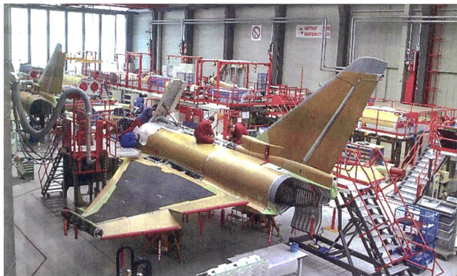
Eurofighter-Fertigung in Manching, Deutschland.

Zwanzig Jahre nach dem Erstflug des europäischen Prestige-Projekt Eurofighter TYPHOON könnte nach 2018 mit der Fertigung in Deutschland Schluss sein. Immer weniger Luftwaffen fragen den Deltaflügler nach. Zuletzt verkaufte Italien noch 28 Stück für acht Mia. Euro nach Kuwait, diese Produktion tangiert die deutschen Werke aber praktisch nicht. Das gleiche gilt laut Airbus für Spanien. Langfristig würden die Produktions-