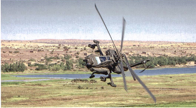
Apache über dem Niger-Fluss in Mali.