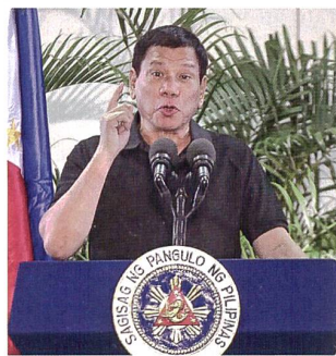
Philippinischer Präsident Rodrigo Duterte.

gendeiner Aufkündigung der Allianz vonseiten der Philippinen erfahren hätten. Auch philippinische Militärs beteuerten, dass sie noch nichts Konkretes erfahren hätten, welche gemeinsamen Übungen und