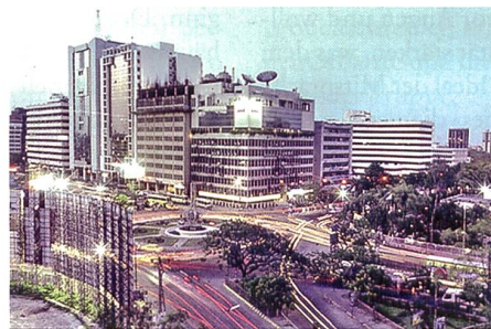
Geschäftsviertel in Dhaka, der Hauptstadt Bangladeschs.

Die Fotos der Täter wurden vom «Islamischen Staat» (IS) nur wenige Stunden nach dem Blutbad im Café Holey Artisan Bakery in Dhaka veröf-