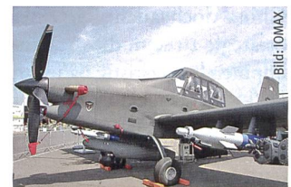
AT-802U Air Traktor ARCHANGEL an der Dubai Airshow.

gezielten, durch Drohnen-aufklärung (chinesische Wing Loong UAV) unterstützte Angriffe von Spezialflugzeugen des Typ ARCHANGEL, aber auch durch Sonderoperationskräfte und Verbündete am Boden geführt. Die ISR-fähige ARCHANGEL, für den Grenzschutz konzipiert, entwickelt sich zusehends zur Multifunktionsmaschine in der Aufstandsbekämpfung. Und so zeigt die Situation in Libyen auf eindrückliche Art und Weise zwei Dinge: Erstens, dass in einem Konflikt mit (zu) vielen verschiedenen Interessensvertretern und unklaren Allianzverhältnissen kein abseh-