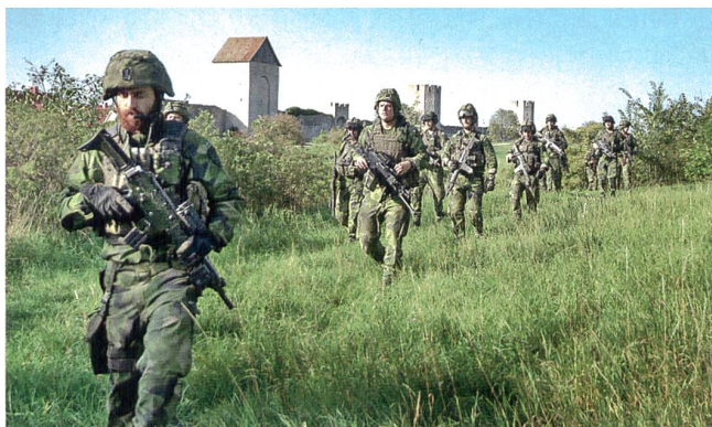
Patrouille auf Gotland.

mandeur der Garnison Gotland mitverfasste, wurde der Entscheid nun vorgezogen. Schweden glaubt tatsächlich an das Invasionsszenario. Deshalb bleiben seit September 150 Soldaten der Skaraborgbrigade bis auf weiteres auf Gotland stationiert. Dass diese einem möglichen Invasor wenig entgegenbringen können, ist auch schwedischen Militärs klar. Es wird davon ausgegangen, dass Russland die Insel innert eines Tages mit ca. 3400 Soldaten auf konventionelle Art einnehmen würde. Aus diesem Grund gibt es in schwedischen Offizierskreisen auch genügend kritische Stimmen, welche die (Wieder-)Befesti-