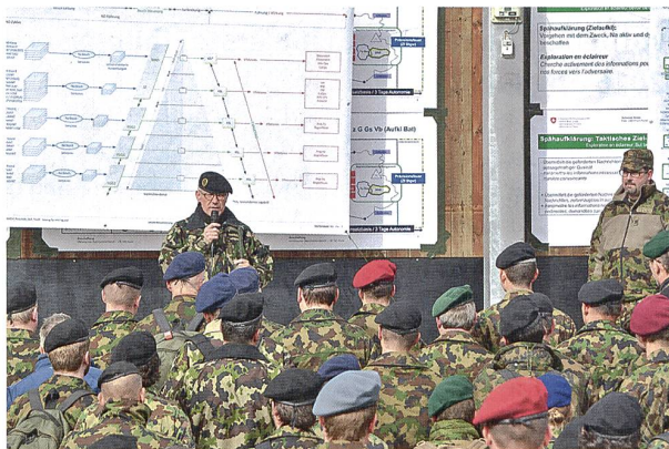
Info Rap MND 2016 im Feld.

Auf einen theoretischen Teil am Vormittag folgte am Nachmittag ein praktischer