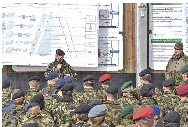
Info Rap MND 2016 im Feld.

Auf einen theoretischen Teil am Vormittag folgte am Nachmittag ein praktischer