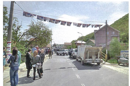
Abb. 4: Roadblock in Zubin Potok (18. April 2016).

und ob dieser eventuell für längere Zeit aufrechterhalten werden sollte. Dies natürlich möglichst diskret und ohne irgendwelche Risiken einzugehen. Es stellte sich heraus, dass für den 19. April in Brüssel sogenannte «technische Verhandlungen» zwischen einer serbischen und einer ko-