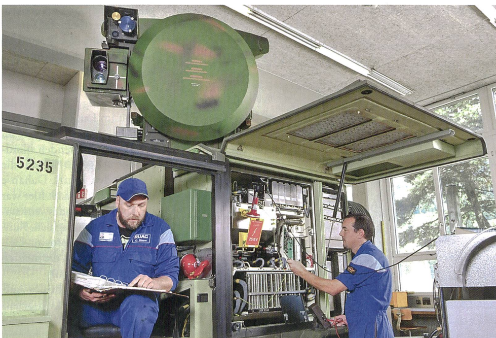
Hochspannungsmessung im Radarsender vom Skyguard des MFlab-Systems.

Der RUAG-Standort Zweisimmen beschäftigt 84 Mitarbeitende und bietet eine breite Palette an Lehrplätzen. Zur Zeit bildet Zweisimmen 15 Lernende in verschiedenen Berufen aus: Automatiker, Elektroniker, Polymechaniker, Logistiker und einen Fachmann Betriebsunterhalt. Die Berufsbildung ist eine wesentliche Grundlage für die zukünftige Entwicklung des Standortes. zvq