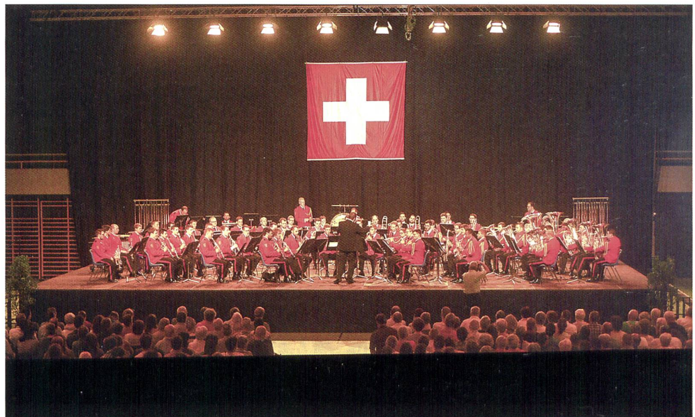
Swiss Army Central Band.

auswärtige Angelegenheiten (EDA) und des Chefs der Armee, Korpskommandant André Blattmann, hat eine Kleinformation der Schweizer Militärmusik die 1.-August-Festlichkeiten der Botschaften in Seoul (Südkorea), Peking