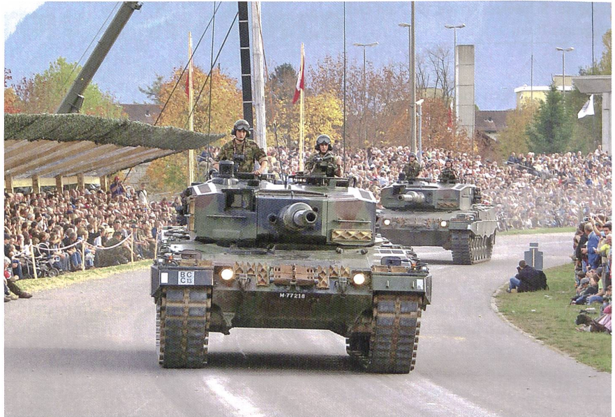
Am 21./22.10.2016 wird jeweils um 1400 ein Defilee auf der Thuner Allmend durchgeführt.

Mit dem Anlass des Lehrverbandes Panzer und Artillerie vom 21. bis 23.10.2016 soll daher nicht nur die Armee von heute der Bevölkerung präsentiert werden, sondern es soll auch die bald 200-jährige Zu-