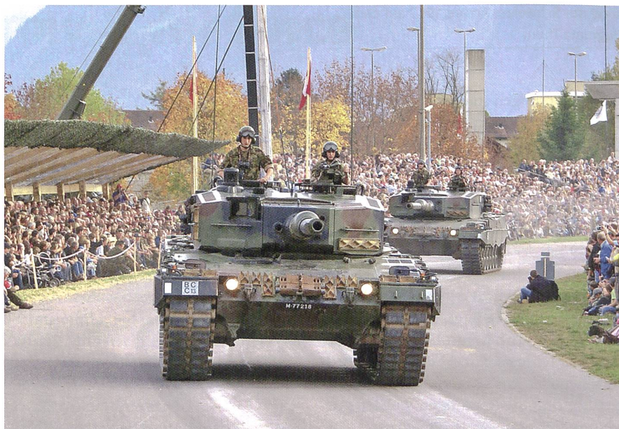
Am 21./22.10.2016 wird jeweils um 1400 ein Defilee auf der Thuner Allmend durchgeführt.

Mit dem Anlass des Lehrverbandes Panzer und Artillerie vom 21. bis 23.10.2016 soll daher nicht nur die Armee von heute der Bevölkerung präsentiert werden, sondern es soll auch die bald 200-jährige Zu-