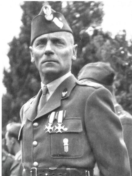
General Prugar-Ketling, Kdt der polnischen Schützendivision.

Am 19. Juni 2015 werden es genau 75 Jahre her sein, dass sich am Grenzposten bei Court-Goumois zwei fremde Offiziere meldeten mit der Bitte, dem französischen und dem polnischen Gesandten in Bern je eine Botschaft zu übermitteln. Darin wurden diese auf die hoffnungslose Lage des 45. Französischen Armeekorps samt der 2. Polnischen Schützendivision aufmerksam gemacht und gebeten, die Schweizer Regierung um die Internierung nach Haager-Abkommen zu ersuchen. Diesem Gesuch wurde umgehend entsprochen, denn der Bundesrat und General Guisan hatten angesichts der aussichtslosen Lage bereits am Vortag einen entsprechenden Beschluss gefasst. So kamen in der Nacht vom 19. auf den 20. Juni das 45. Armeekorps unter General Daille und die 2. polnische Schützendivision unter der Leitung von General Prugar-Ketling – letzterer mit Erlaubnis des polnischen Hauptquartiers in London! – sowie rund 7 000 Zivilpersonen in