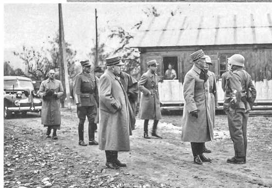
General Guisan besucht das Lager in Büren.

Für die Internierten galten strenge Regeln. Sie mussten ausserhalb der Lager stets ihre Uniform tragen und es war ihnen strengstens verboten, ohne Bewilligung die Bahn zu benützen, Fahrrad zu fahren sowie Privatwohnungen oder Wirtshäuser zu betreten. Auch der Besuch von Kinos und Sportveranstaltungen waren nicht erlaubt. Ein vor allem auch an die Schweizerinnen gerichtetes «Kontaktverbot» sollte ein Anbandeln mit den galanten Polen verhindern. Es scheint nicht viel genutzt zu haben, denn bis Kriegsende heirateten 316 Schweizerinnen einen Polen und 369 Polen wurden Väter von unehelichen Kindern!