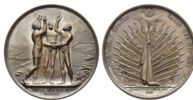
Medaille Offiziersfest Langenthal 1822.

Der Versuch, Krise und Krieg von 1798 und 1799 zu überwinden, führte Schweizer aller politischen Tendenzen im frühen 19. Jahrhundert zum Versuch, am Rütli wieder anzuknüpfen. Eine Zürcher Medaille von 1802 zeigt die drei Bundesgründer, die Unspunnenfeste 1805 und 1808 gehören in denselben Kontext. Den Anspruch, das Rütli der modernen Schweiz gewesen zu sein, kann Langenthal für sich beanspruchen, des Offiziersfests von 1822 wegen, jenes Urfest einer festfreudigen, auf eine