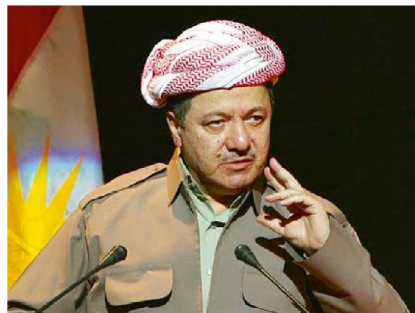
Massoud Barzani, Präsident der autonomen Region Kurdistan.

der irakischen Armee im Kampf mit dem IS und sind dabei derartig erfolglos, dass nicht nur der internationale Flughafen unter die Kontrolle des IS geraten könnte, sondern sogar ein Vordringen in die Hauptstadt noch immer nicht auszuschliessen ist. Neben den irakischen Kämpfern, die das Land am Boden gegen den IS vertei-