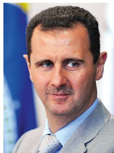
Der syrische Präsident Baschar al-Assad.

Der Kampf gegen den IS kann nur gemeinsam gewonnen und die bereits existierende humanitäre Katastrophe ist nur in einer gemeinsamen, koordinierten Anstrengung in den Griff zu bekommen.