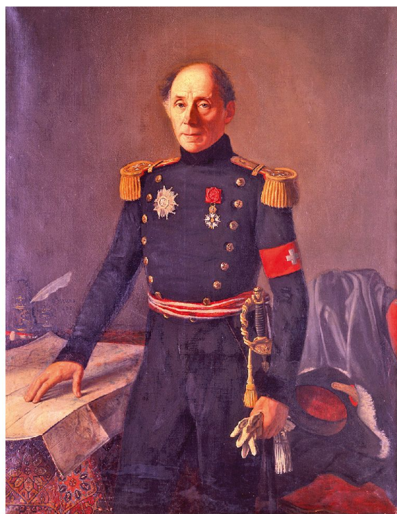
Général Guillaume-Henri Dufour (1787–1875).

La convention protège le personnel de secours aux blessés: selon les termes de