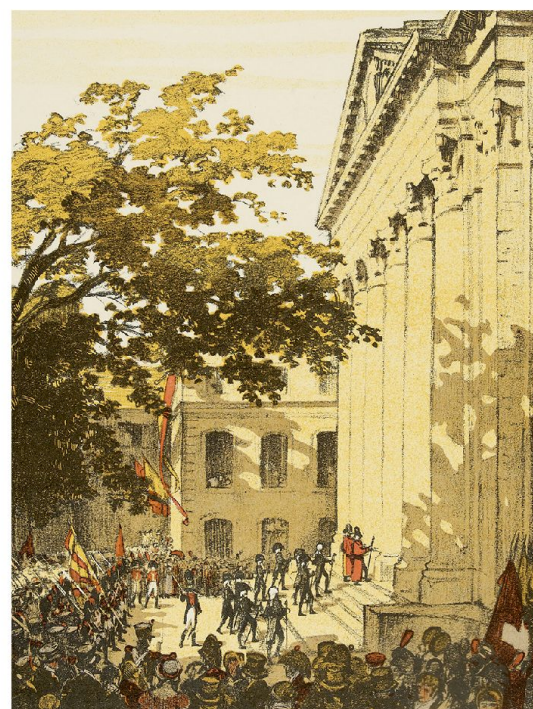
Genève devient un canton Suisse le 12 septembre 1814.

A travers le parcours du général Dufour, on constate tout le paradoxe de l'histoire contemporaine de la Suisse en général et de Genève en particulier: construire la