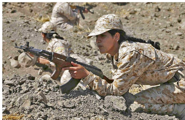
Wie in der IS kämpfen auch zahlreiche Frauen mit den Peschmerga.